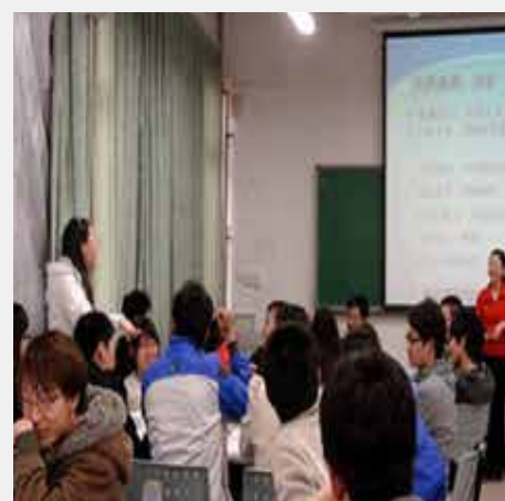
学生与老师互动 主动提问