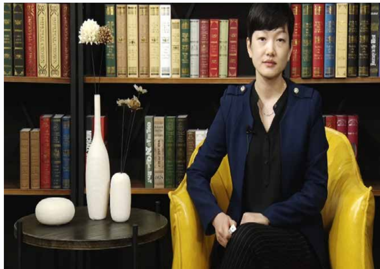
海大、南开、川大、厦大四校共建 政府、企业参与,社会知名讲师