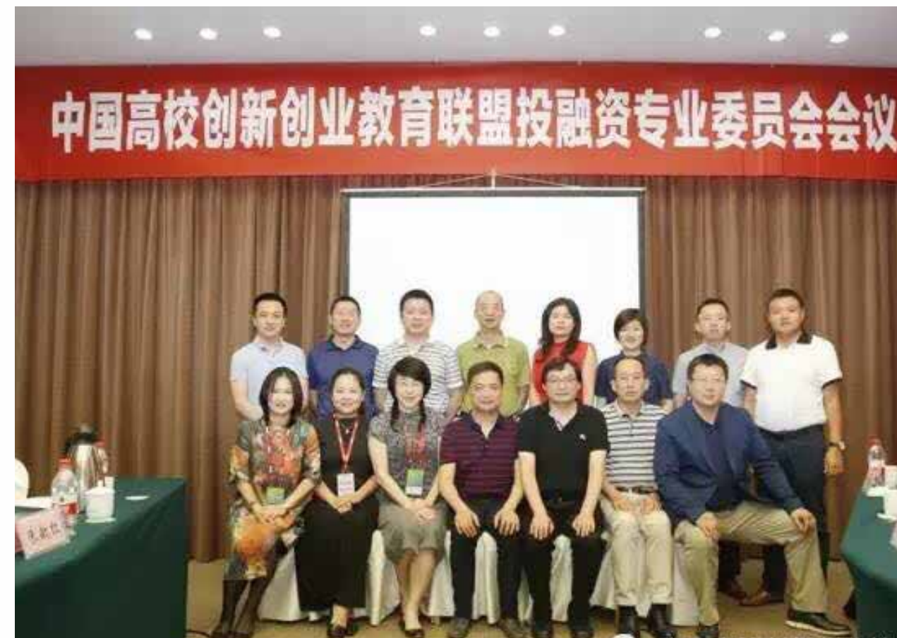
中国创新创业 教育联盟投融委的投资人