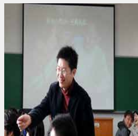
老师不断启发 学生大胆设问