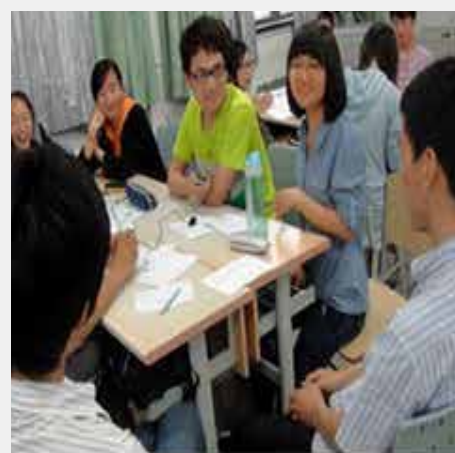
学生分成小组 学习成长