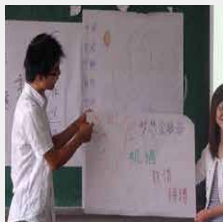
参与教学 使学生充分参与课程