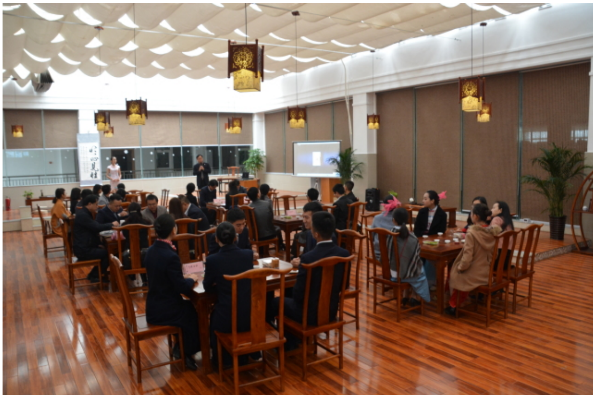
利用大益爱心茶室开展实践教学