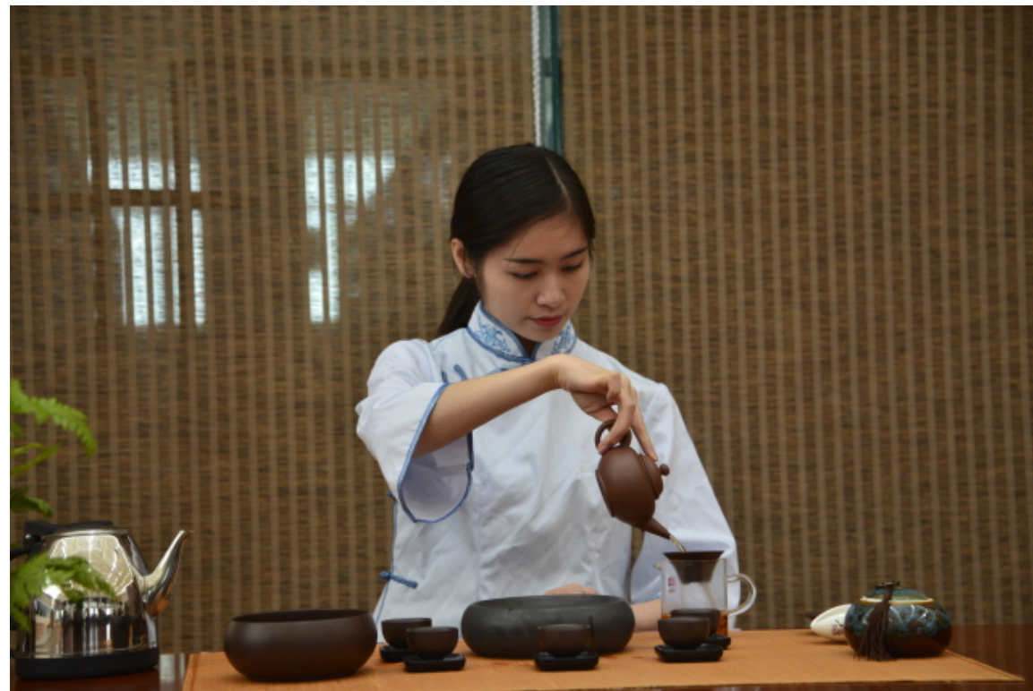
课程助教在进行教学展示