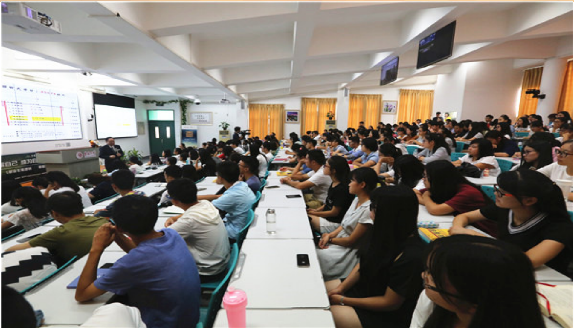
沉浸式远程互动直播教室——荷风直播教室（C5-103）