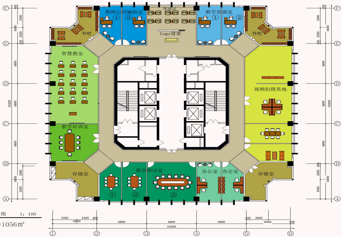
教师教学发展中心整体规划——行政办公大楼25层